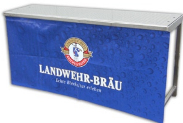
1008 Theke (B/T 200 x 60 cm), mit Verkleidung, ohne Ausschank