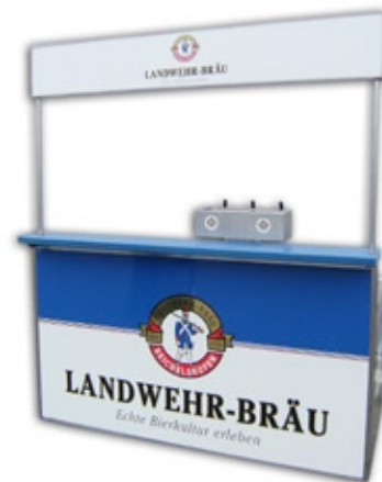
1011 Messtheke groß (B/H/T: 200 x 220 x 70 cm) inkl. einem Spülbecken und Mischbatterie, 2-3 Hahnen