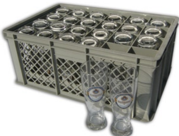
1303 Gutmannglas 0,5 Liter Korb à 24 Stück