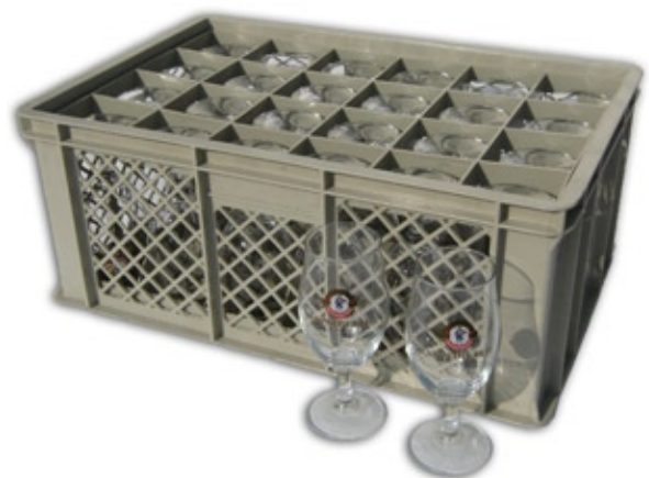
1307 Pils-Pokale 0,4 Liter, Korb à 24 Stück