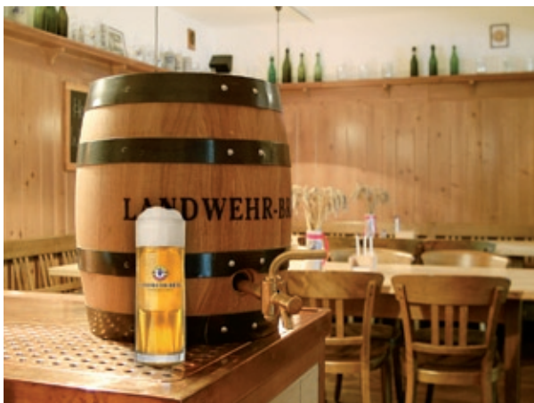
1506 Holzfass für Bieranstich