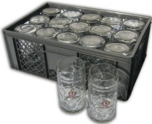
1301 Festkrug 1,0 Liter, Korb à 15 Stück