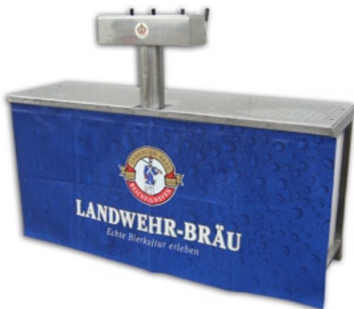
1007 Theke (B/T: 200 x 60 cm), mit Ausschank und Verkleidung, 2-4 Hahnen