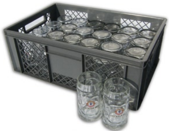
1300 Festkrug 0,5 Liter, Korb à 24 Stück