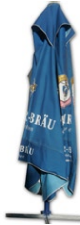
1406 Sonnenschirm 350 x 350 cm 1405 Preistafel