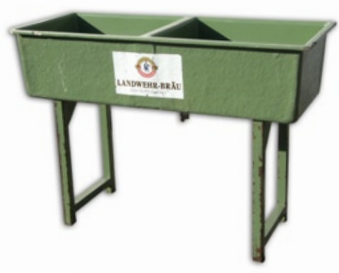
1032 Spülwanne grün, 2 Becken, Gekapplung, inkl. Spülmittel und Bürste